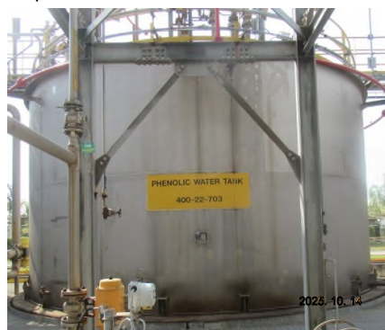
ภาพถ่ายที่ 2.2-4 Phenolic Water Tank