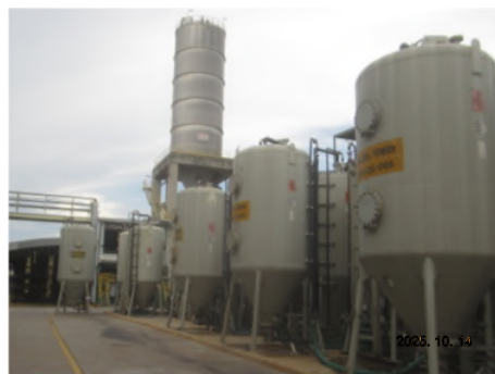
ภาพถ่ายที่ 2.2-10 Activated Carbon Adsorber ของโครงการผลิต PC