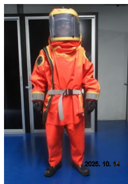
ภาพถ่ายที่ 2.2-21 ชุดป้องกันสารเคมี