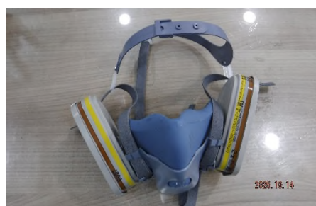
ภาพถ่ายที่ 2.2-20 หน้ากากป้องกันสารเคมีชนิดดัดโค้ง