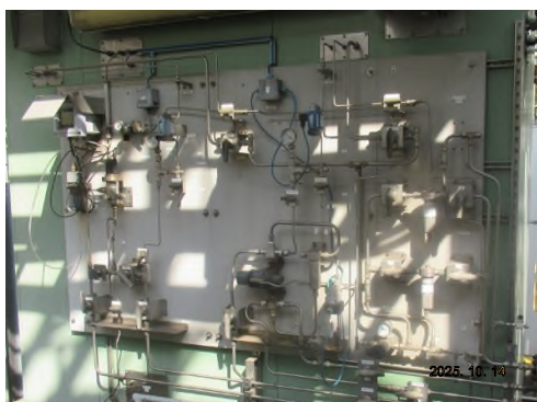
ภาพถ่ายที่ 2.2-3 อุปกรณ์ TOC Online