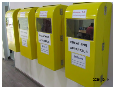
ภาพถ่ายที่ 2.2-22 หน้ากากชนิดถังติดตัวบุคคล (SCBA)