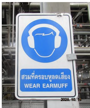
ภาพถ่ายที่ 2.2-1 ป้ายเตือนให้สวมใส่อุปกรณ์ป้องกันเสียงดัง