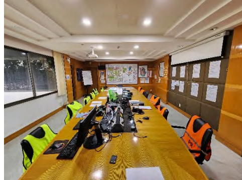
ภาพถ่ายที่ 2.2-24 ศูนย์ปฏิบัติการควบคุมภาวะฉุกเฉิน (ECC)