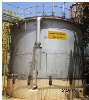
ภาพถ่ายที่ 2.2-9 Stripped Wastewater Tank