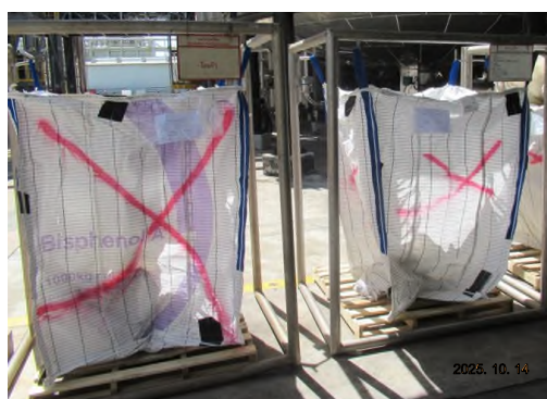
ภาพถ่ายที่ 2.2-14 ภาพขณะบรรจุ บริเวณลานเก็บของเสีย