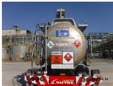
ภาพถ่ายที่ 2.2-18 รถขนส่งวัตถุดิบและสารเคมี