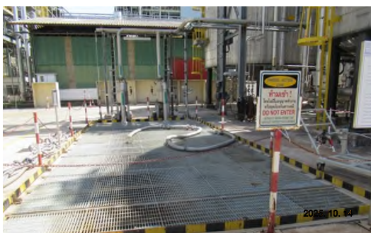
ภาพถ่ายที่ 2.2-11 Process Wastewater Sump