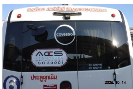
ภาพถ่ายที่ 2.2-19 รถรับส่งพนักงานบริษัท