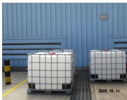
ภาพถ่ายที่ 2.2-15 Scrap Area