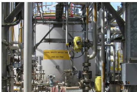
ภาพถ่ายที่ 2.2-5 Final Wastewater Tank