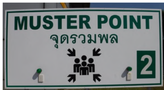
ภาพถ่ายที่ 2.2-25 จุดรวมพลของโครงการ