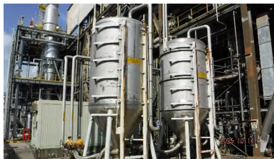
ภาพถ่ายที่ 2.2-6 ระบบดูดซับด้วยถ่านกัมมันต์ ของโครงการผลิต BPA