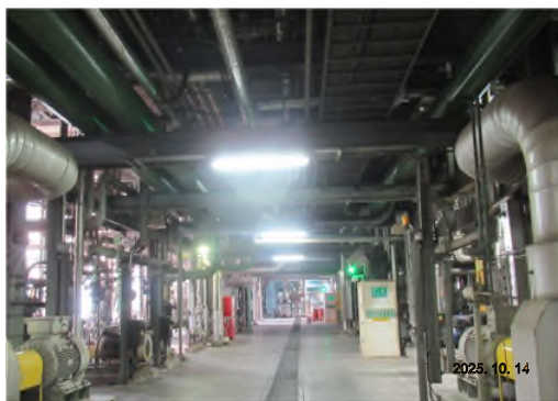
ภาพถ่ายที่ 2.2-17 ไฟส่องสว่างภายในพื้นที่โครงการ