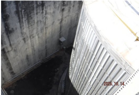
ภาพถ่ายที่ 2.2-23 Gas Detector ที่ตั้งเก็บ Acetone