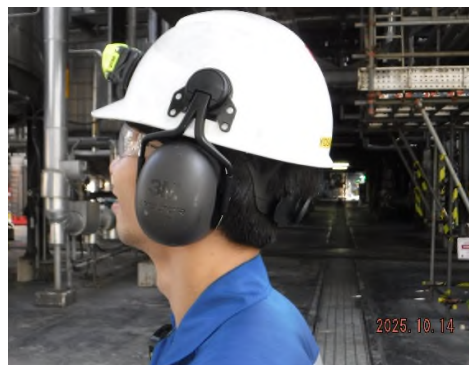
ภาพถ่ายที่ 2.2-2 อุปกรณ์ป้องกันอันตราย ส่วนบุคคล (PPE) สำหรับพนักงานที่สัมผัสกับเสียงดัง