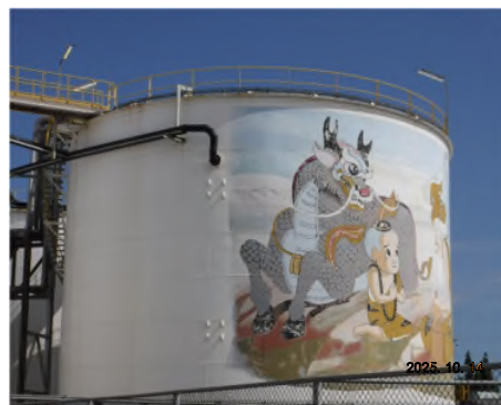
ภาพถ่ายที่ 2.2-8 Hold Tank สำหรับกักเก็บน้ำเสีย