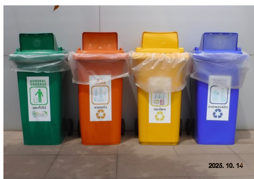
ภาพถ่ายที่ 2.2-13 ถังขยะแยกประเภท