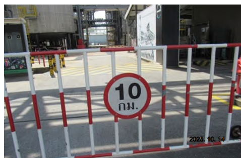
ภาพถ่ายที่ 2.2-16 ป้ายเครื่องหมายจราจรในพื้นที่โครงการ