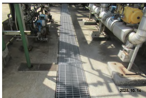
ภาพถ่ายที่ 2.2-12 รางระบายน้ำภายในพื้นที่โครงการ